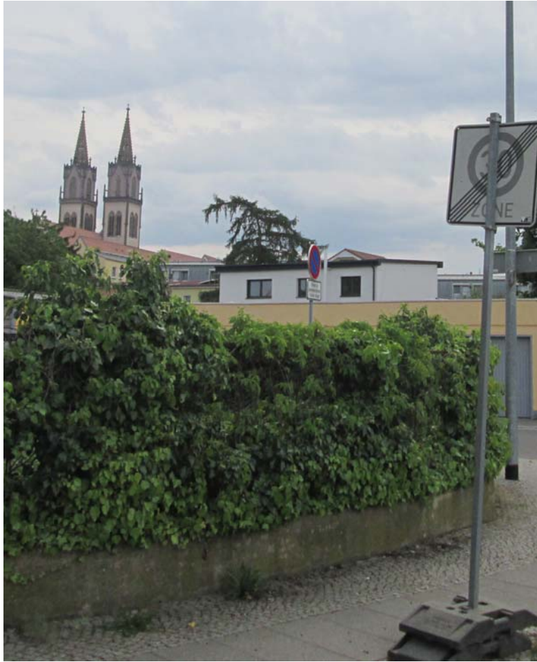
Ansicht Ost PV