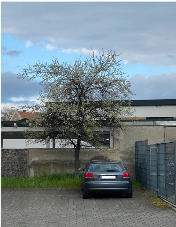
Parkplatz Promenade hinter Vitaris